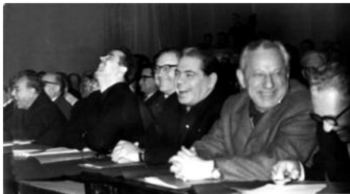
Здесь и далее жюри ...

Спектакль двигали вперед, этому продвижению препятствовали все. И вот - сам фестиваль. В старом ДК МГУ на Моховой все вокруг оцеплено, и попасть туда невозможно. Жюри фестиваля, совместно с другими тогдашними «звездами», возглавляет Аркадий Райкин. После спектакля – овация со стоящим жюри в течение пятнадцати минут. Фурор! На следующий день фестиваль закрывают, делают этот день выходным, потому что надо выдвигать победителя и говорить о нем в прессе. А он всем очевиден.