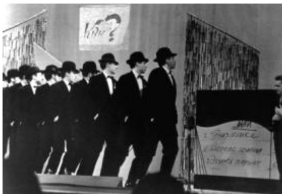
Команда Чарли Чаплиных

Чарли Чаплиных и репризами в стихах из разминки до сих пор балуют зрителей в юбилейных выпусках КВН, а номер «Лекция о смехе» признан студенческой классикой до сей поры.