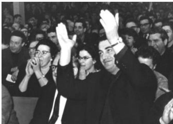
Зрительный зал ...

Мы поняли, что спектаклю конец, и распрощались с «Телевизором».