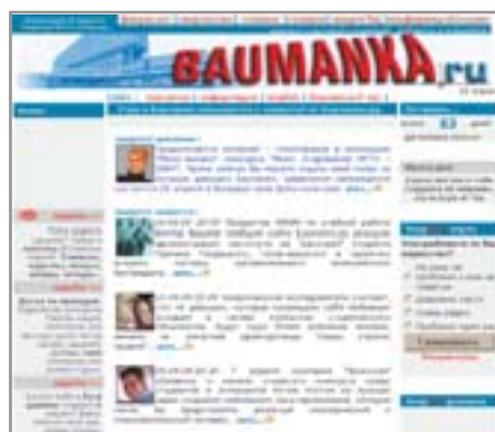
▲ Студенческая Baumanka.ru: факультет «Энергомашиностроение»

www.mpgu.ru — Московский государственный педагогический университет.