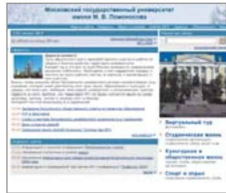
▲ Московский государственный университет им. М. В. Ломоносова

» своей альма-матер является гимн Бауманке, размещенный в разделе «Творчество».