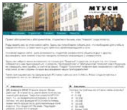
▲ МТУСИ: неофициальная зона для студентов-связистов