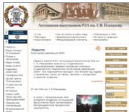
▲ Сайт выпускников экономической академии им. Г. В. Плеханова

» ческих олимпиадах. Студенческий сайт института www.fizteh.ru — интернет-портал братства «Легендарный Физтех» — информирует посетителей о расписании занятий на текущий учебный год. Также здесь есть много другой справочной информации — от телефонного справочника Физтеха до интернет-магазина физтеховской литературы.