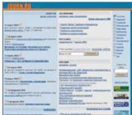
▲ «Журфак Independent» — сайт студентов журфака МГУ