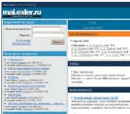
▲ Mai.exler.ru — сайт будущих авиационных инженеров