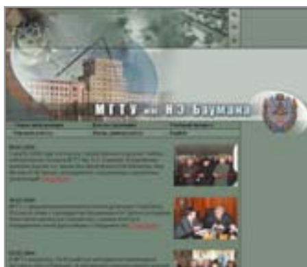
▲ Официальное веб-представительство МГУ им. М. Э. Баумана

Будущие журналисты назвали свой сайт «Журфак Independent» ( www.journ.ru ).