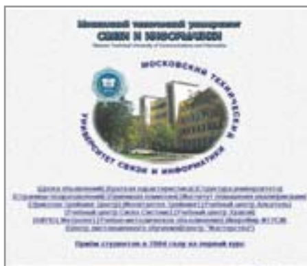
▲ Официальный сайт МТУСИ (Институт связи и информатики)